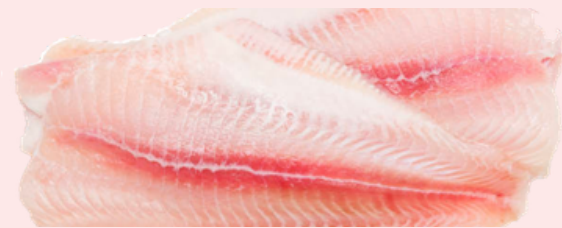
Nombre Común: Bagre