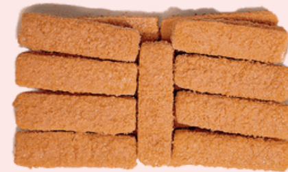
Nombre Común Dedos de Pescado