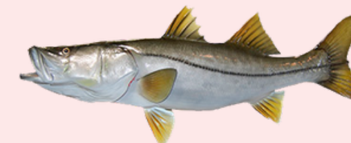
Nombre Común: Robalo