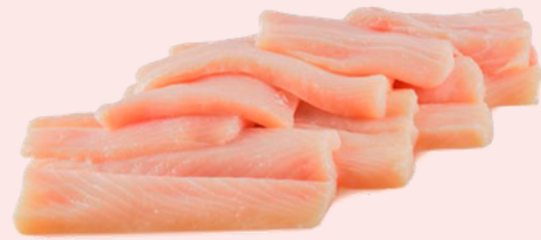
Nombre Común: Tiburón