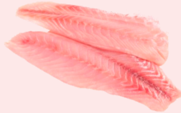
Nombre Común: Robalo