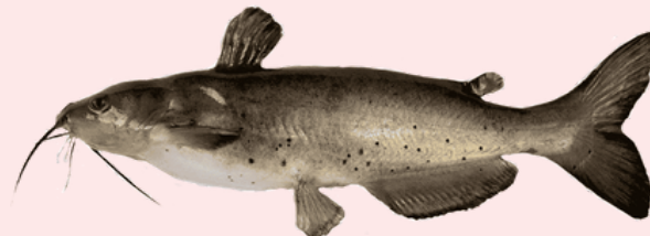
Nombre Común: Bagre