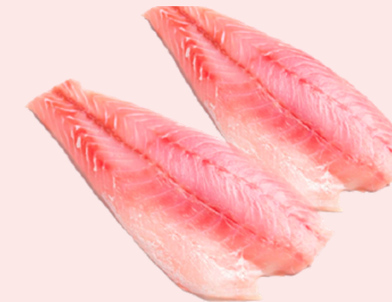
Nombre Común: Mero