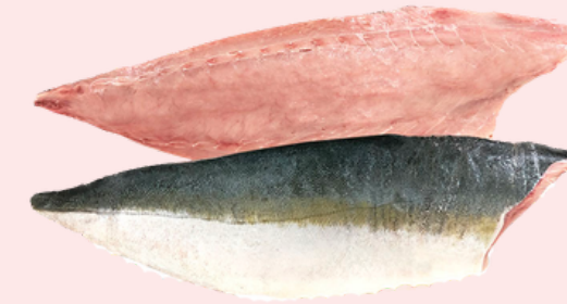
Nombre Común: Jurel