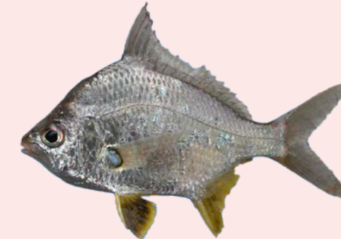
Nombre Común: Palometa