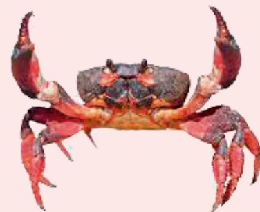
Nombre Común: Punche