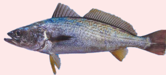
Nombre Común: Corvina