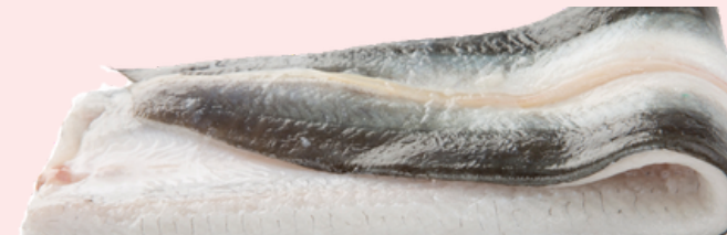
Nombre Común: Anguila