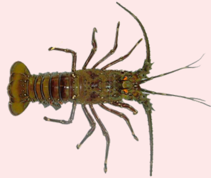
Nombre Común: Langosta Entera del Pacífico