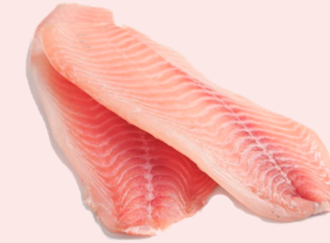
Nombre Común: Tilapia