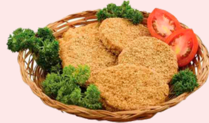
Nombre Común Torta de Pescado