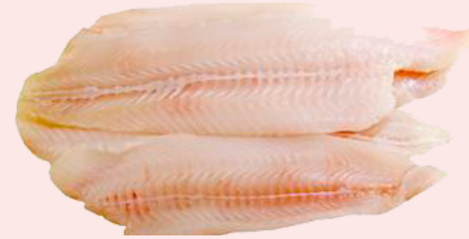
Nombre Común: Lengudo