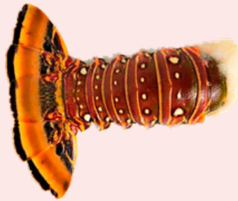
Nombre Común: Cola de Langosta del Caribe