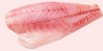
Nombre Común: Corvina