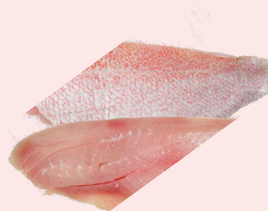
Nombre Común: Pargo