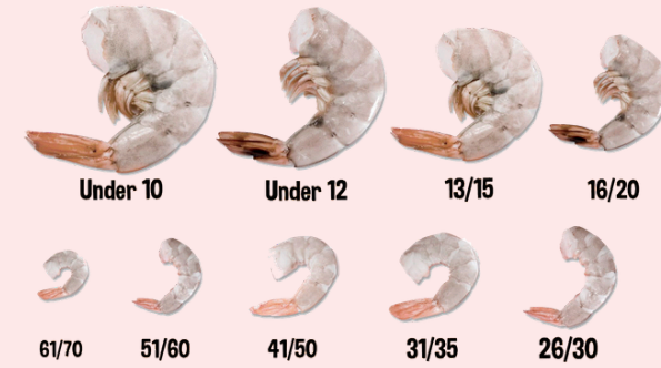
Variedad de tallas Camarones