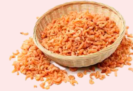
Nombre Común: Chacalín Seco