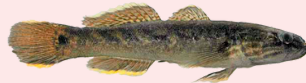
Nombre Común: Guabina