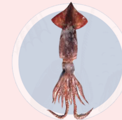
Nombre Común: Calamar