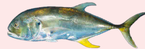
Nombre Común: Jurel