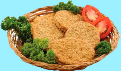
Nombre Común Torta de Pescado