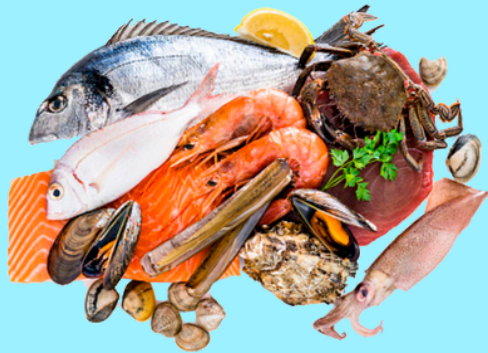
Nombre Común Mariscada