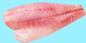
Nombre Común: Corvina