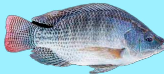
Nombre Común: Tilapia