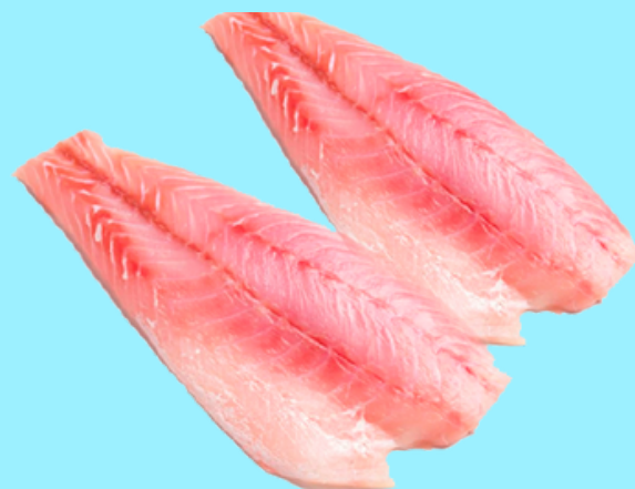
Nombre Común: Mero