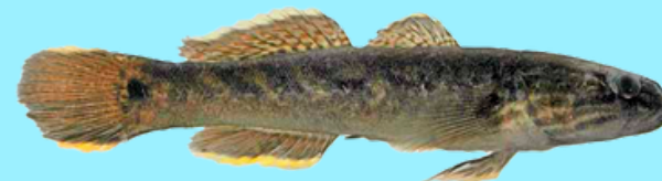
Nombre Común: Guabina