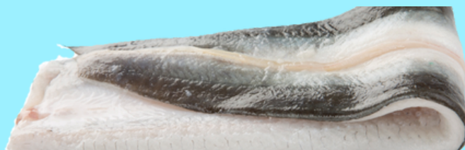
Nombre Común: Anguila