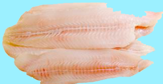
Nombre Común: Lengudo