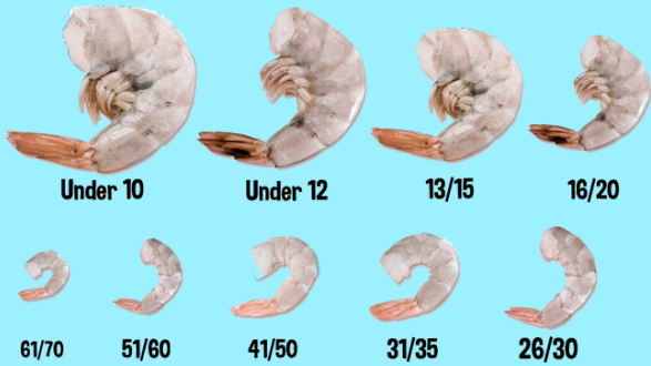
Variedad de tallas Camarones