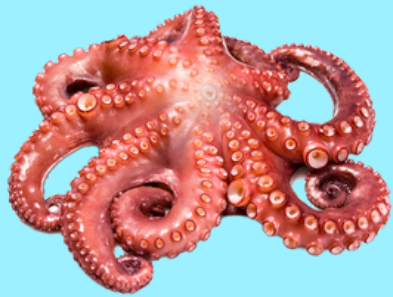
Nombre Común: Pulpo