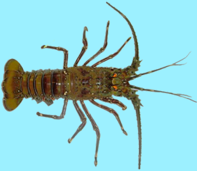
Nombre Común: Langosta Entera del Pacifico