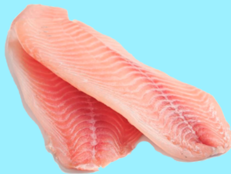
Nombre Común: Tilapia