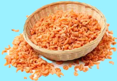
Nombre Común: Chacalín Seco