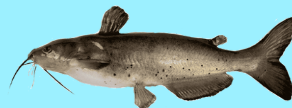
Nombre Común: Bagre