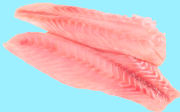
Nombre Común: Robalo