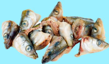
Nombre Común: Cabeza de pescado