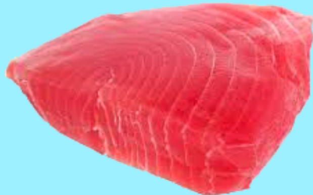
Nombre Común: Atún