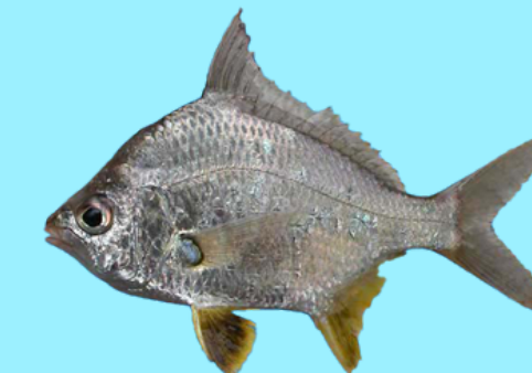
Nombre Común: Palometa