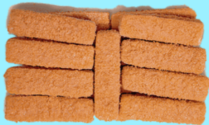
Nombre Común Dedos de Pescado