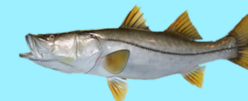
Nombre Común: Robalo