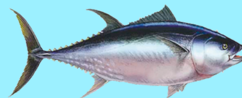
Nombre Común: Atún