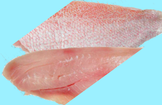
Nombre Común: Pargo