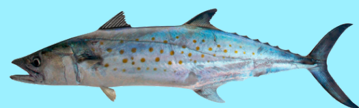
Nombre Común: Macarela