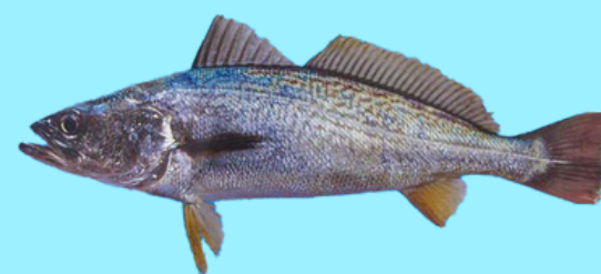
Nombre Común: Corvina