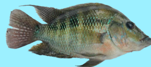
Nombre Común: Mojarra