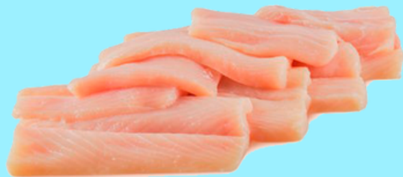
Nombre Común: Tiburón