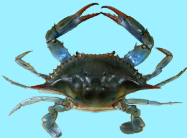
Nombre Común: Jaiba