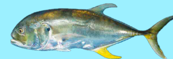
Nombre Común: Jurel