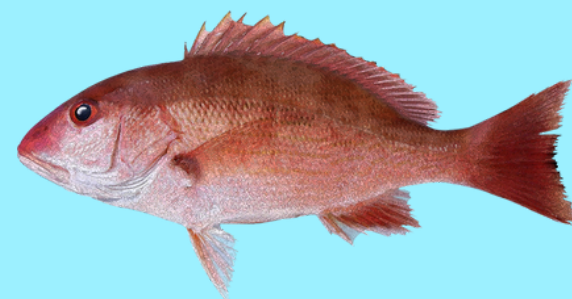
Nombre Común: Pargo Rojo