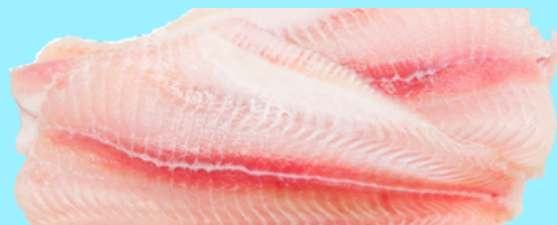
Nombre Común: Bagre