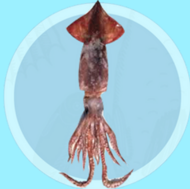
Nombre Común: Calamar