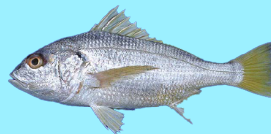
Nombre Común: Ruco