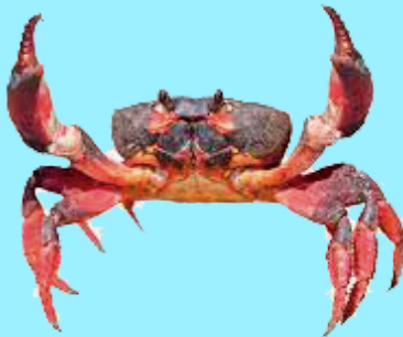
Nombre Común: Punche