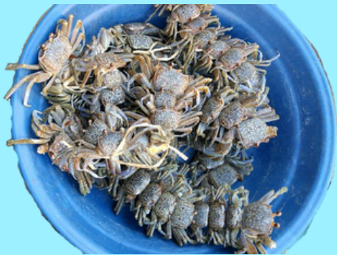
Nombre Común: Champainano