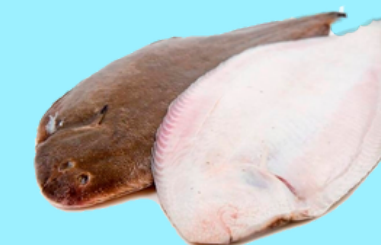
Nombre Común: Lenguado