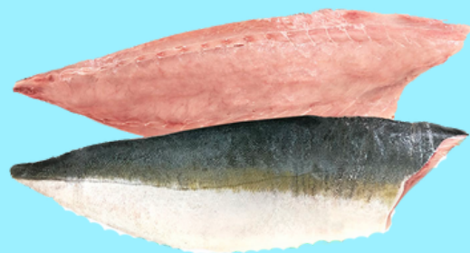
Nombre Común: Jurel