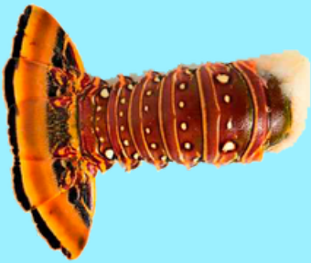
Nombre Común: Cola de Langosta del Caribe